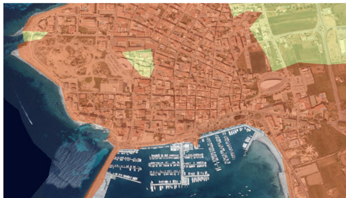
Figura 1. Mapa Vulnerabilidad de Acuíferos.